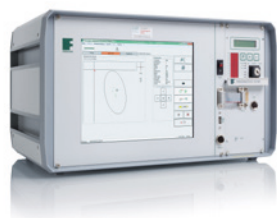
図1: MAGNATEST ECMコンパクト型

熱処理されたアルミニウム部品と熱処理されていないアルミニウム部品は、導電率に顕著な違いがあります。これが、渦電流方式の検査とソーティング処理の基本的な前提条件になります。