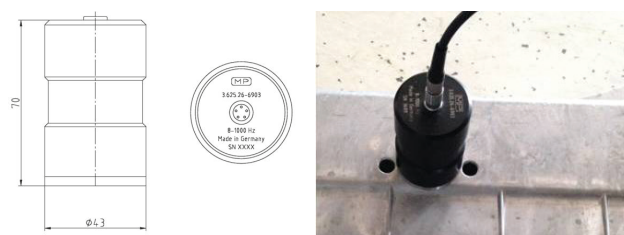
図2: プローブの略図と使用例

ライン上では、これが完全に自動化されます。部品は検査直後にソーティング処理されます。検査システムの多彩な文書化機能と評価機能が、目標とする品質保証をサポートします。